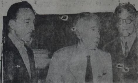
El ex presidente de la República Española, Alca's Zamora, aparece en compañía de sus hijos a la llegada al puerto de Buenos Aires.