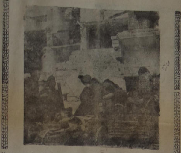
Un aspecto de Bengasi, que ha vuelto a caer en poder de las tropas del general Rommel

La firma Byola ha organizado un certamen muy interesante, a ba-