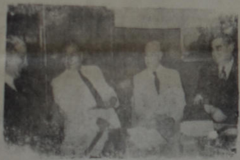
El senador Tamborini y varios miembros del comité Nacional del Radicalismo, momentos antes de realizar la reunión en minoría