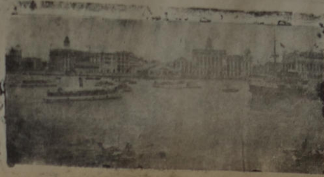
Eso, es el aspecto puramente político. Que habría mucho que hablar del aspecto económico y aún del militar. Pero eso es tema para otros comentarios.

En resumen: mientras no se ataca sinceramente el mal en sus mismas raíces, lo demás será banal. Mientras los gobiernos no de- jen de la o escrupulos e intere- ses subterráneos y teno es inju- stificado, acordado honestamente la resolución TOTAL de las maniobras totalitarias, las rupturas serán in- trascendentes. Mientras subsistan el complot y la actividad totalitaria, pese a la ruptura oficial, no se ha- brá ganado ningún paso. Más, aun- que no haya ruptura, si son apas- tados sin discriminación los esfuer- zos del totalitarismo por copar a América, se habrá dado el paso más ventajoso en la defen- sa continental.