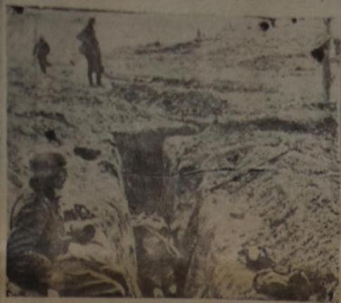
En las cercanías de Leñgrado se parece, aunque rudimentaria, la trinchera que fuera característica de la anterior guerra.

h).—Los Jefes de Distritos Forestales propondrán anualmente la división de zonas o secciones de explotación, las que se irán explotando por turno, de manera que una misma zona o sección no sea explotada sino cada diez años.