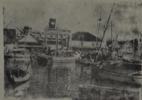
Mascasar, en los célebres, teatro de una encarnizada lucha contra los nipones.