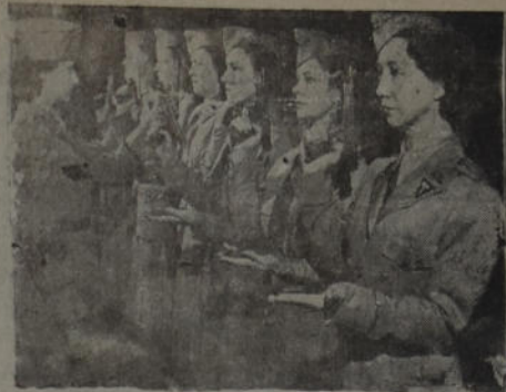
Un grupo de los integrantes del hospital del cuerpo de la reserva, de Nueva York, y que forman a su vez en el 4º regimiento auxiliar, aprendiendo el manejo de las armas de su instructor militar.

El pensamiento de hoy No hay nadie que en su interior no esté con la soga al cuello. (Anónimo).