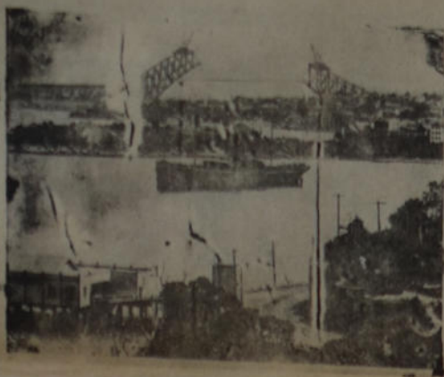
Una vista del puerto de Sydney, en Australia, en la que se puede apreciar la magnitud del puente Levadizo, aún inconcluso, y que se considera el más grande del mundo.