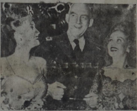
El brigadier general Alretcox, jefe del selectivo servicio, aparece aquí en una recepción oficial, entre las actrices de cine Dorothy Lamour y Betty Grable.

queza agraria, ganadería y agricultura, dando a esas naciones carnes y cereales de que carecen. Luego lo que en este cuestionario llevase hecho, denuncia la posibilidad efectiva de lo que sostenemos. De que la Argentina debe realizar sacrificios y esfuerzos presentes en pro de su mejor jerarquización industrial, porque implicará su riqueza social próxima. El subsuelo nacional irá dándose poco a poco los medios que hayan de completar nuestra absoluta grandeza industrial.