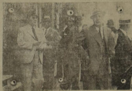
En Montevideo las autoridades requisaron importantes documentos de un local ocupado por las oficinas de la Transoceam

Siendo evidente la reducción de la ganadería en Europa, lógico era que un país como el nuestro, cuya riqueza está representada en gran parte por sus haciendas, tratase de preservar e intensificar su economía mediante la conservación de las unidades de cría, con el objeto de poder hacer frente más tarde a la gran demanda que fatalmente se producirá por parte de las naciones que actualmente han restringido sus pedidos o han dejado de negociar con nosotros