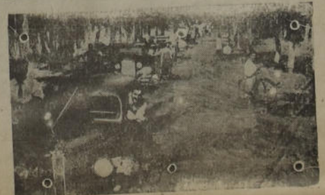
Como se ve en la foto las recientes inundaciones en Mendoza causaron serios daños.

Consultorio en Buenos Aires: Corrientes 2215 - U. T. 48 Pasco 2270