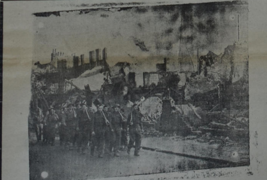
Voluntarios británicos se dirigen a una zona de Londres para efectuar reparaciones en los lugares bombardeados por la aviación alemana