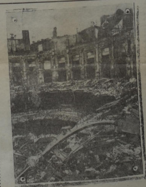
La llamada «Casa de la Música» en la ciudad de Londres por ser el lugar donde se realizaron los más importantes conciertos, aparece en ruinas por la acción de los aviones germanos

no haya clases privilegiadas. El hombre elegante que busca sus adeptos en los salones y entre la oficialidad de las instituciones armadas, argumenta con el fantasma de la dictadura del proletariado.