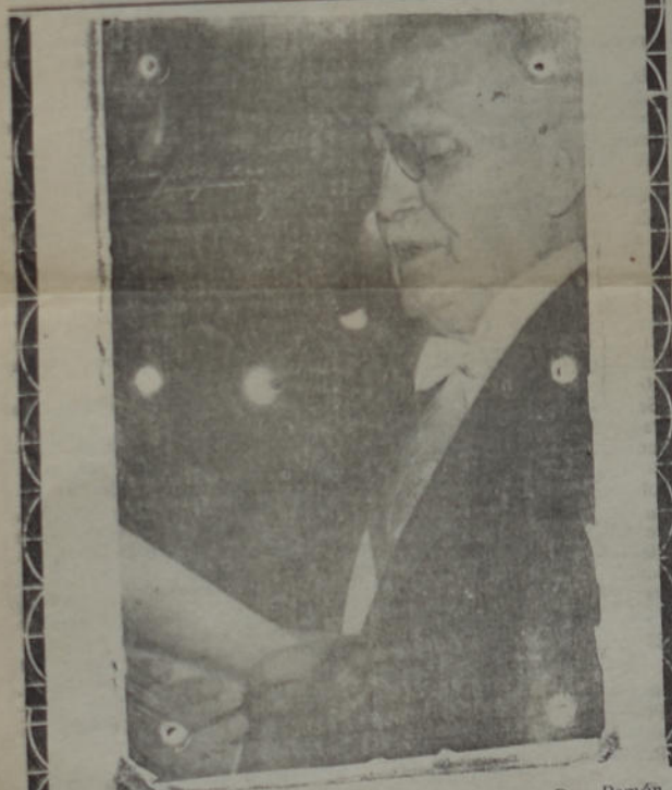
El vicepresidente de la República en ejercicio del poder, Dr. Ramón S. Castillo, leyendo el mensaje ante la Asamblea Legislativa. En su mensaje el mandatario se refirió a distintos aspectos de la vida económica y política del país.