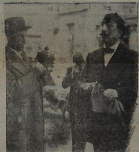
El senador Nacional Dr. Alfredo Palacios en momentos de entrar al Senado para informar acerca del negociado de las tierras de El Palomar es acedido por los fotógrafos

Continúan las investigaciones sobre las tierras de El Palomar