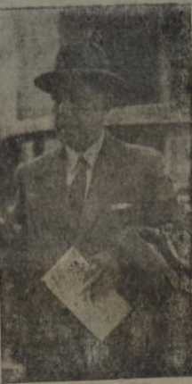
El senador Galindez en el instante de penetrar al Congreso para asistir a la sesión que consideró el informe de la Comisión investigadora