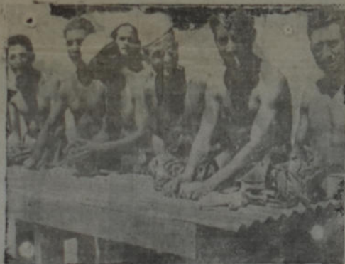
Soldados italianos tomados prisioneros por los ingleses en el Africa, declararon al ser interrogados que no tienen ninguna simpatía por la causa que el duce quiere obligarles a defender

lazos comunes. Por eso, precisamente, antes de abordar los temas concretos de la defensa real, ambos cancilleres, con un buen criterio que nunca se alabará bastante,