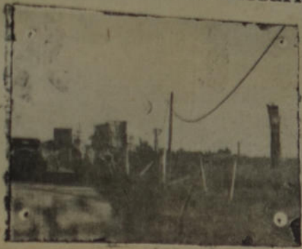
Postes y cables caídos señalan la violencia del ciclón que azotó a Rosario

sinena ni nadie vender lo que no le pertenece.