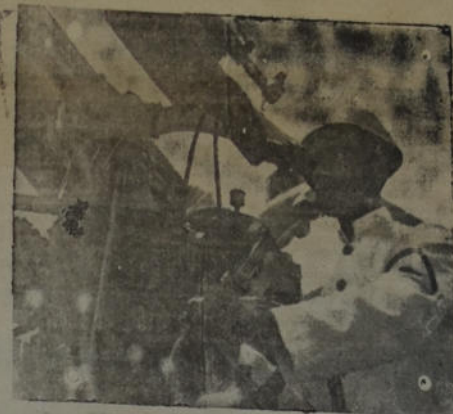
Oficial artillero de la Marina de Grecia poniendo en funcionamiento un cañón antiaéreo de una nave.