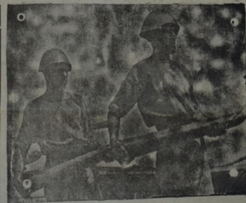
Artilleros griegos provistos de cascos de acero listos para cargar los cañones del crucero «Averoff»