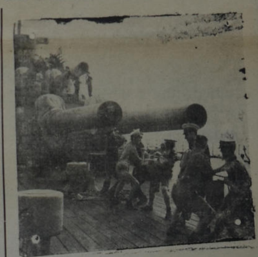
Un acorazado británico durante el bombardeo del fuerte de Bardia