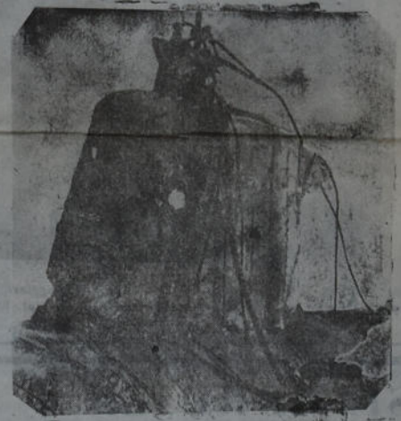
Estado en que quedó la torre de un submarino japonés que fue alcanzado por una bomba de un avión norteamericano