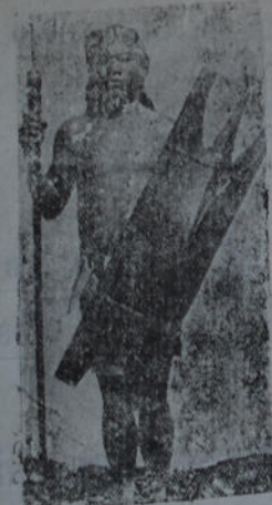
Con estos nativos el Gral. McArthur formó un ejército que tuvo gran actuación en el Pacífico

No obstante ello, esas familias están ya sobre el camino, sin techo. Aunque parezca asombroso, no hay en nuestro país una ley que otorgue al trabajador del campo cierto derecho de permanencia sobre la tierra que ha fecundado con su energía, que lo ponga a cubierto de las arbitrariedades de propietarios muchas veces ociosos.