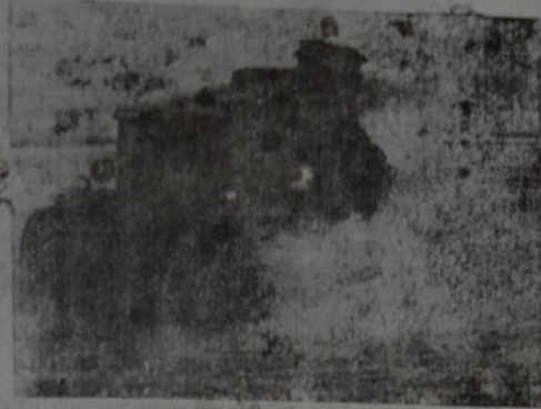
El nuevo tanque liviano de combate del ejército norteamericano ha sido fotografiado levantando nieve y barro en una de las pruebas que fué sometido