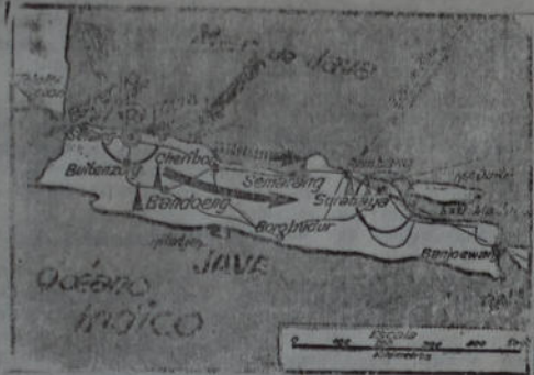
Fuerzas neerlandesas, que se oponen al avance nipón en Java