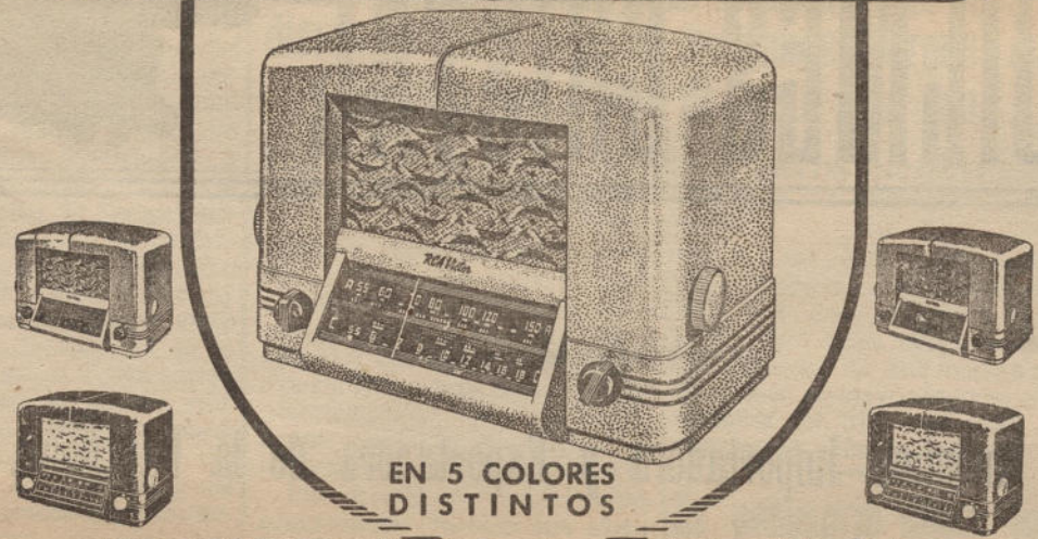
EN 5 COLORES DISTINTOS

Las más extraordinarias características de rendimiento y la más hermosa, moderna y atractiva presentación, han sido resumidas en los nuevos superheterodinos RCA Victor «New Yorker»!... Así como su circuito radio-eléctrico refleja el progreso máximo de la técnica contemporánea, así también sus exquisitos gabinetes, de líneas aerodinámicas, reflejan el encanto, la