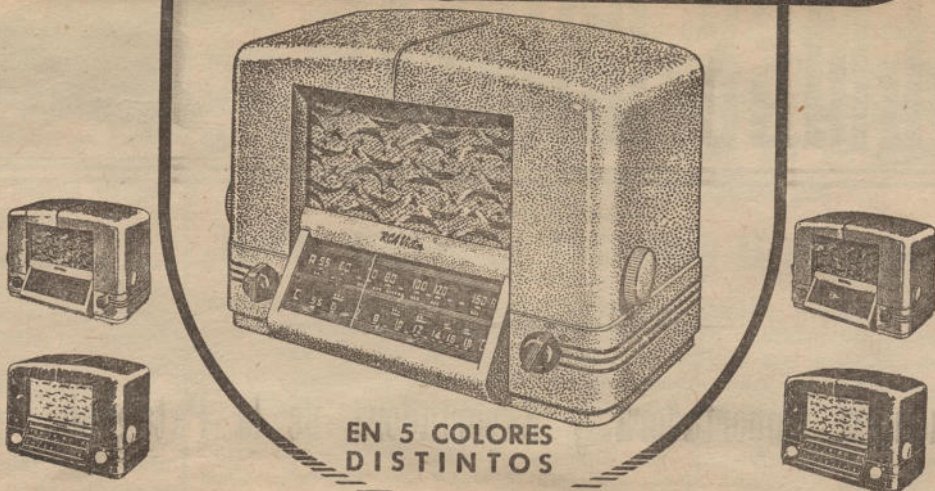
EN 5 COLORES DISTINTOS

Las más extraordinarias características de rendimiento y la más hermosa, moderna y atractiva presentación, han sido resumidas en los nuevos superheterodinos RCA Victor «New Yorker»!... Así como su circuito radio-eléctrico refleja el progreso máximo de la técnica contemporánea, así también sus exquisitos gabinetes, de líneas aerodinámicas, reflejan el encanto, la