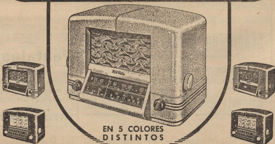
EN 5 COLORES DISTINTOS

Las más extraordinarias características de rendimiento y la más hermosa, moderna y atractiva presentación, han sido resumidas en los nuevos superheterodinos RCA Victor «New Yorker»!... Así como su circuito radio-eléctrico refleja el progreso máximo de la técnica contemporánea, así también sus exquisitos gabinetes, de líneas aerodinámicas, reflejan el encanto, la