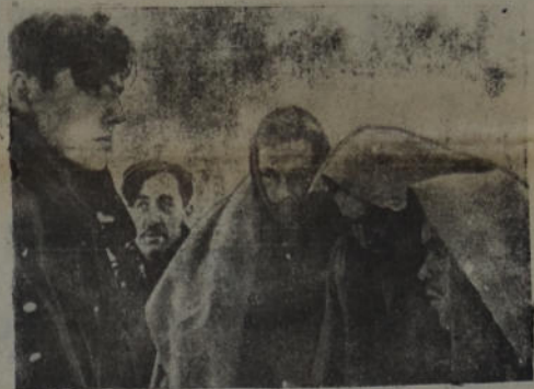
Tipo de los prisioneros tomados por los rusos en su ofensiva contra los alemanes :: :: ::

poetas franceses, su libro «Las flores del mal» le produjo 300 francos... y un proceso. A Paul de Kock: ¡28 millones de francos! sus malas novelas.