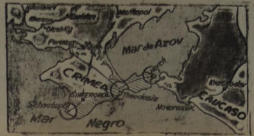
Acciones violentas se desarrollan en la península de Crimea. Las fuerzas soviéticas procedentes de Kerech han establecido contacto con la guarnición de Sebastopol

Von Brauchichi, ha quien habría llamado Hitler para que lo asesore en la preparación de los planes de la ofensiva de primavera contra Rusia