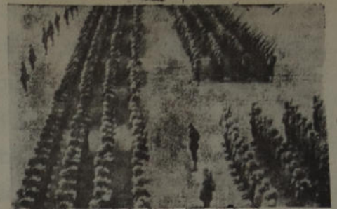
En un lugar de Irlanda ha sido tomada esta fotografía que muestra un contingente de tropas llegadas recientemente a dicho punto, enviadas desde los Estados Unidos para cooperar en la defensa y en la organización militar