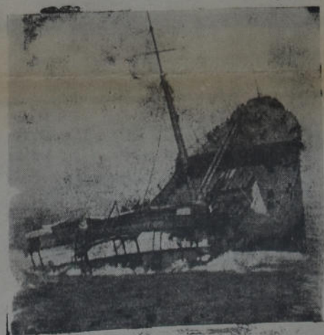
Esta foto muestra los últimos momentos del vapor «Guiltrade», torpedeado por un submarino alemán. Uno de los tripulantes la obtuvo desde el bote en que se alejaba