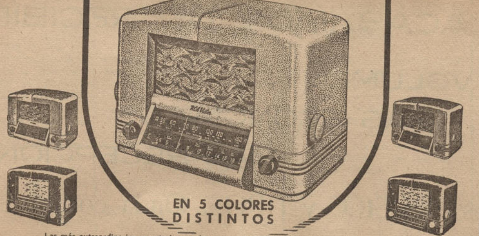
EN 5 COLORES DISTINTOS