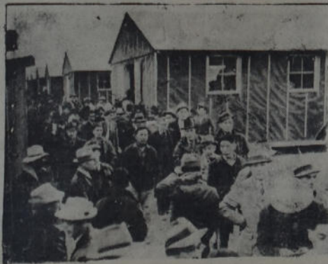
Radio foto tomada en Melbourne muestra la acogida dispensada al general MacArthur para hacerse cargo de la defensa de Australia