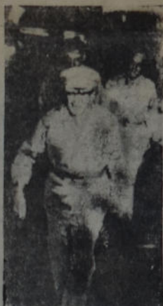
El general Mac Arthur que se hizo cargo de la defensa de Australia

Notables adelantos muestra la industria química y farmacéutica. Mu-