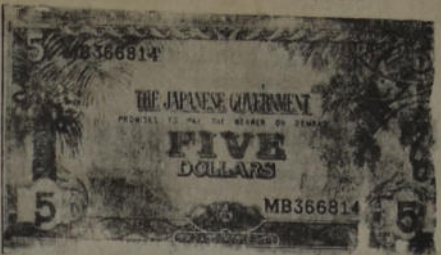
Arriba) Esta vista aérea muestra los últimos momentos de un buque alemán antes de hundirse. Abajo) Los japoneses pagan en las zonas ocupadas con dólares de ocupación. La foto muestra uno de estos.