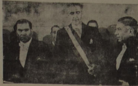
Juan Antonio Ríos presta el juramento de práctica en el acto de la asunción del mando.