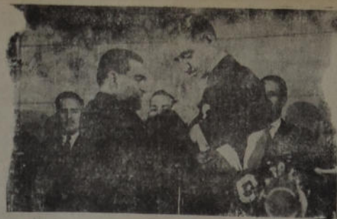
El presidente del Senado de Chile coloca la banda al nuevo presidente de ese país Juan Antonio Ríos