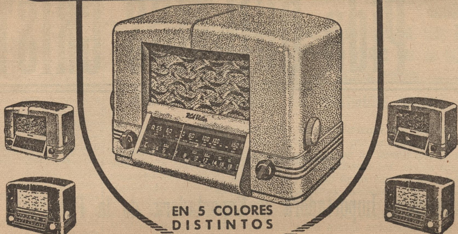
EN 5 COLORES DISTINTOS