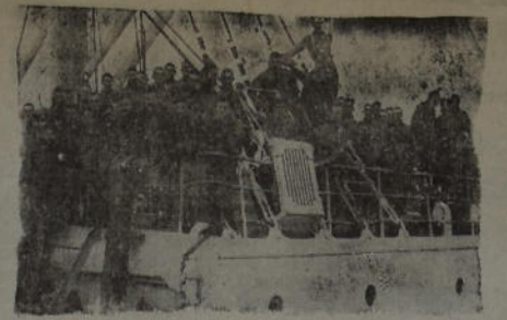
El 14 de Infantería de línea antes de partir para Comodoro Rivadavia donde se establecerá esa unidad