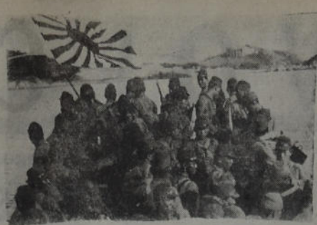
Tropas japonesas de invasión, en China