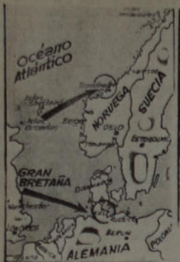
Puntos atacados por los aviones de R.F.A

Los hombres obligados a tener relaciones con el público deberían saturar siempre la atmósfera que los rodea con aquel desinfectante