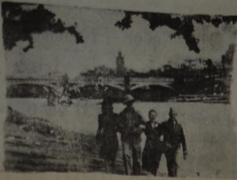
Por los alrededores de Melbourne, Australia, vemos a estos soldados de EE. UU. de las tropas norteamericanas que acudieron a reforzar la guarnición del quinto continente, paseando con jóvenes y lindas muchachas australianas

vientes que se regocijaron por haberse salvado de un naufragio colectivo.