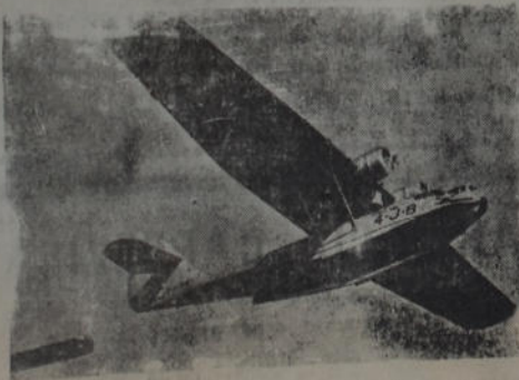
Un hidroavión bimotor de las fuerzas navales de Estados Unidos remolca un blanco sobre el que ejercitan puntería los artilleros de las baterías antiaéreas emplazadas en los buques de guerra de la Unión.