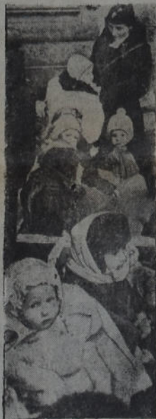
Con motivo del sitio que sufre Leningrado, las autoridades rusas se ven obligadas a trasladar los niños hacia lugares más seguros

No se deja equivocar, por chauffeurs u otras personas; ordene terminantemente: HOTEL HISPANO. AV. DE MAYO 861 - BUENOS AIRES