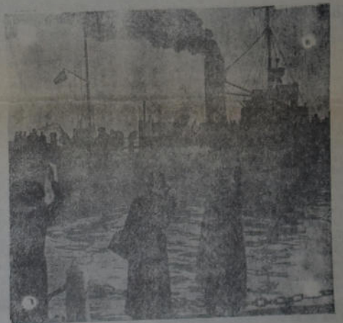
Otro aspecto de la partida de marinos alemanes a Martín García, donde permanecerán hasta el final de la guerra. Muchos connacionales los despeden en el puerto.