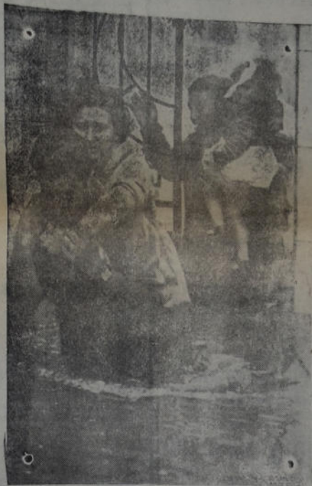
Escenas como estas se registraron en el Bajo Belgrano a consecuencia de la crecida de las aguas. Los vecinos debieron ser sacados en andas de sus domicilios

nales. En estas finas, primas y cru- zas finas habrá que esperar que, pasado este momento de transición y regularizada la demanda, los nue- vos precios permitan fijarla con alguna exactitud; entre tanto, vol- vemos a repetir, carecemos de mercado.