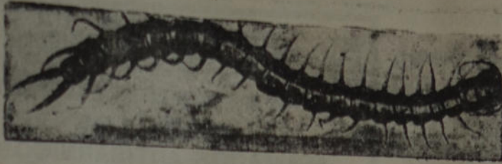
La escolopendra gigante, que fué hallada por un estudiante en la Capital Federal