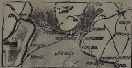
En una de las más fuertes reacciones provocadas por la contraofensiva rusa, el Gral. Zhuhev se ha abierto paso a través del curso superior del Dnieper, entre Derive y Derogobutzh. Esta operación tiende a eliminar la saliente que forman Vyazma, y Gzhatst

En cuanto al transporte de carnes ovinas de Tierra del Fuego —termina diciendo el Sr. Salvá— tiene una trascendental importancia en nuestro comercio de carne, pues vamos a entrar al mercado norteamericano luego de más de quince años, desde 1925, en que fué cerrado por aducirse la existencia de fiebre aftosa. Eso va a representar un porvenir enorme para la ganadería argentina.