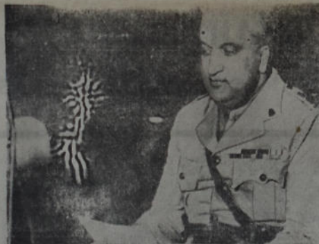
El Maharaja de los Estados Cachemir y Jammu, que ostenta el estado mayor general del ejército angloindia, visitó las defensas británicas en el Cercano Oriente y se dirigió luego al pueblo de la India desde la radioemisora de El Cairo exhortándolo a la lucha.