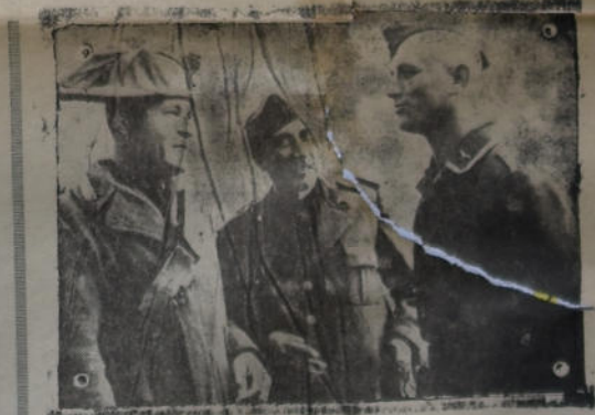
Jefes del ejército alemán recorriendo las calles de una ciudad italiana. Estos soldados llegaron a Italia con el propósito de prestar servicios en las bases aéreas fascistas.