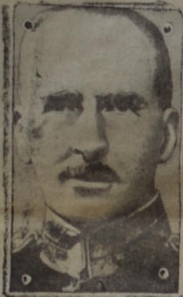
El general Dill, de activa participación en la actual contienda europea

anuncia que desde el 20 del corriente recibirá carga para los puertos del sur.