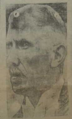
El presidente de Turquía, Ironu, cuya actitud en los actuales momentos, frente a las exigencias alemanas, tiene una importancia trascendental.

FORD 8 , modelo 1936, de buen estado, a toda prueba, se vende equipado con radio, busca huellas, etc., muy barato.