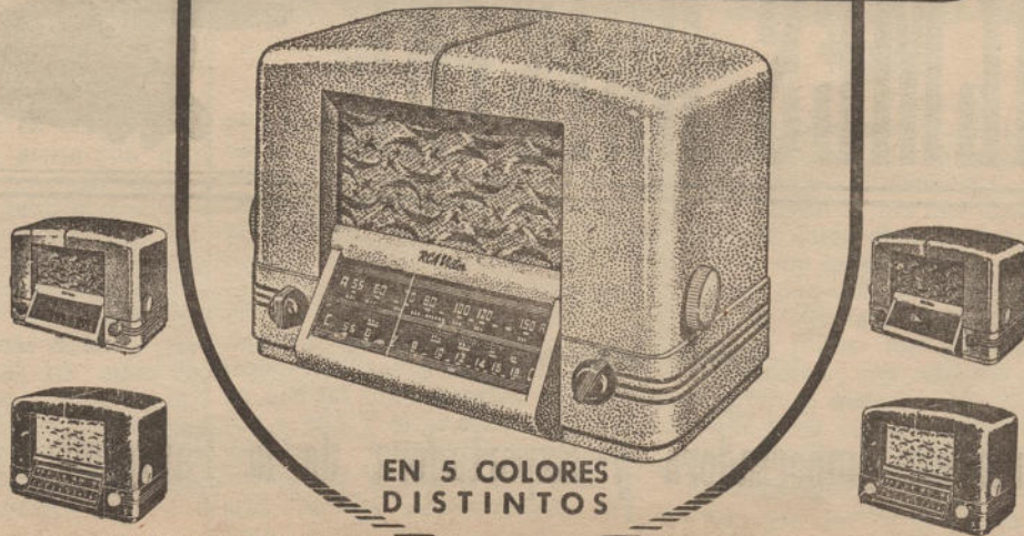
EN 5 COLORES DISTINTOS

Las más extraordinarias características de rendimiento y la más hermosa, moderna y atractiva presentación, han sido resumidas en los nuevos superheterodinos RCA Victor «New Yorker»!... Así como su circuito radio-eléctrico refleja el progreso máximo de la técnica contemporánea, así también sus exquisitos gabinetes, de líneas aerodinámicas, reflejan el encanto, la