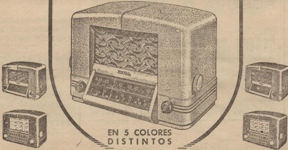
EN 5 COLORES DISTINTOS